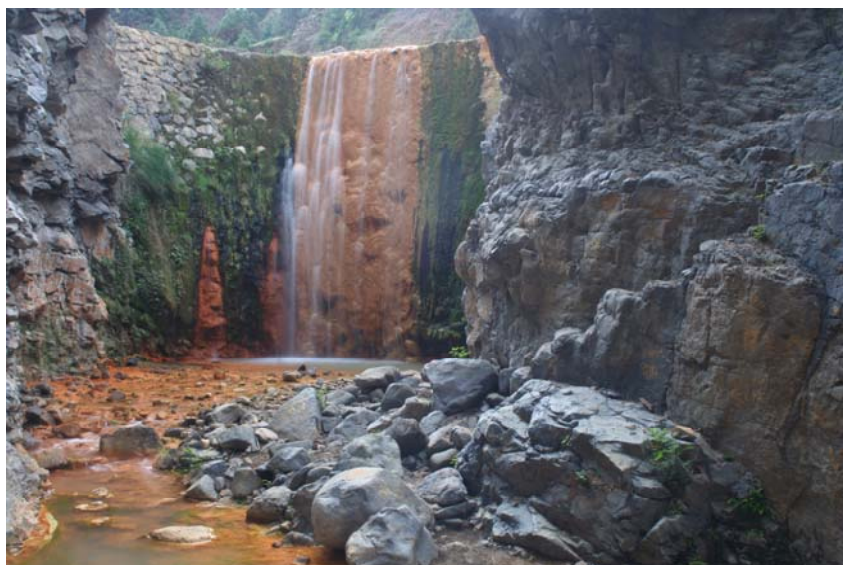
Imatge del Parc de Caldera Taburinete, un dels Parcs estudiats

En aquesta segona de creació on el concepte de xarxa i interactivitat son un dels eixos principals, s'incorpora un experimentat equip d'enginyeria de sistemes audiovisuals per portar a terme la proposta expositiva.