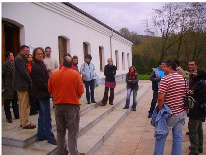
Imatge de la rebuda al Centre de Recursos

L'abril serà el més en que s'elaborarà l'Acta fundacional de la Federació. Us mantindrem informats i informades perquè hi pugueu dir la vostra.