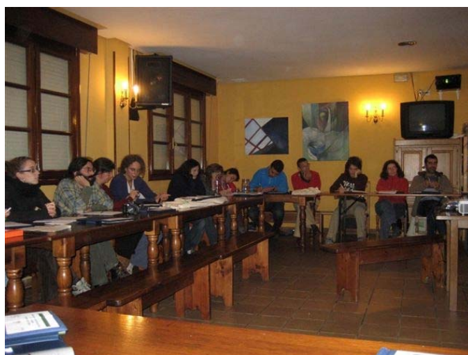
Treballant a l'alberg per l'elaboració dels Estatuts