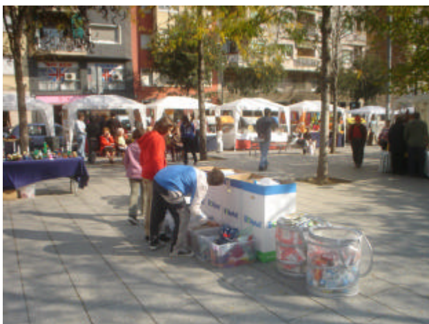
Mostra realitzada a la plaça Virreina

Durant l'any 2007, la SCEA va endegar el projecte "Zoco" dels Tresors. La proposta consisteix en oferir a nens i nenes de 0 a 12 anys, a les seves famílies i a educadors la possibilitat d'accedir a materials i objectes "valuosos" des d'una perspectiva ambiental i pedagògica. Els materials són subproductes, restes de sèrie, objectes obsolets o arraconats procedents de tallers, petites indústries i botigues velles que es volen renovar o que tanquen.