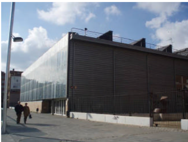
Biblioteca de Mataró, amb panells solars a la façana

L'any 2007 l'Oficina Agenda 21 (Servei de Ciutat Sostenible) de l'Ajuntament de Mataró decideix desenvolupar un pla local d'educació per a la sostenibilitat al municipi. L'Oficina Agenda 21 de Mataró va demanar a dues sòcies de la SCEA assessorament i suport tècnic per al projecte. Aquestes sòcies van proposar que la col·laboració es vehiculés a través de la SCEA, i tant l'Ajuntament de Mataró com la Junta directiva de la SCEA hi van estar d'acord.