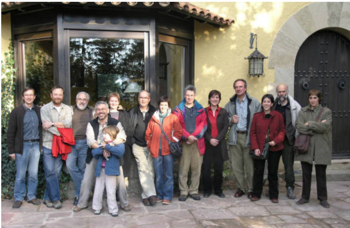
Trobada de l'equip de treball amb el grup assessors