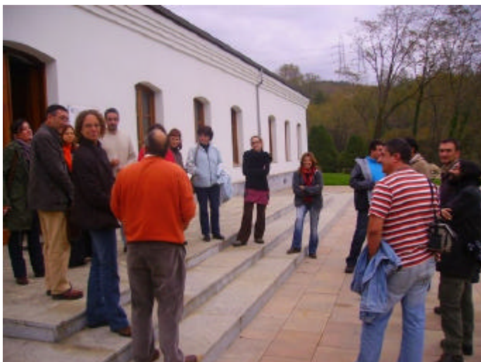
Imatge de la rebuda al Centre de Recursos de Cantabria

El darrer dia, com a cloenda, vam fer una visita guiada per les Coves de EL SOPLAO, a la Sierra del Escudo.